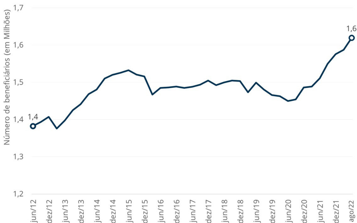
Gráfico A1. Evolução do número de beneficiários vinculados a planos médico-hospitalares no estado de Santa Catarina entre dez/12 e ago/22.

Fonte: SIB/ANS/MS – 08/2022. Dados extraídos pelo IESS em 06/10/2022.